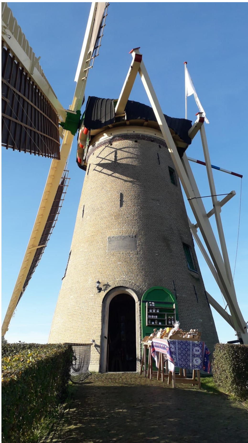
Jaarverslag 2022 Rijsoordse molen